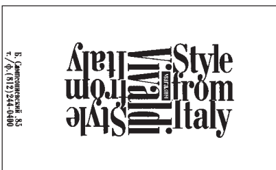
Интересный дизайн выделит визитную карточку из ряда подобных