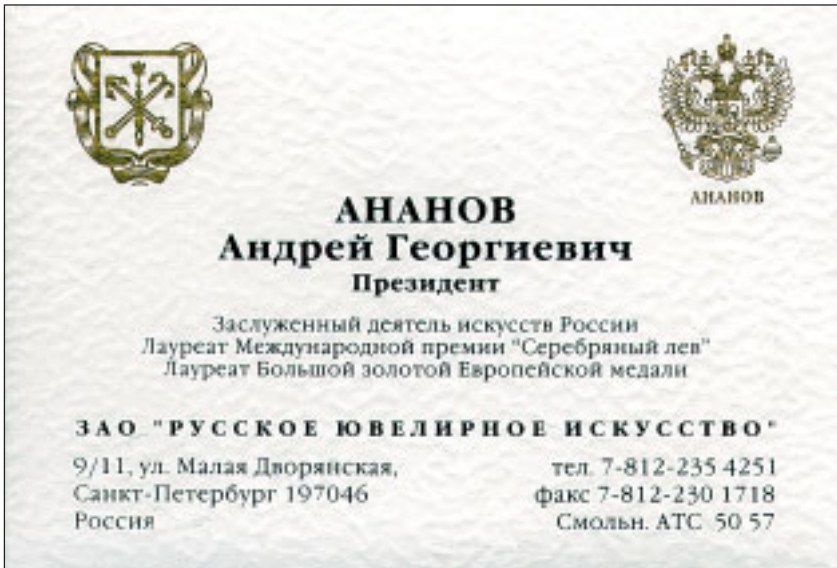
Визитка ювелира Андрея АНАНОВА необычно крупных размеров