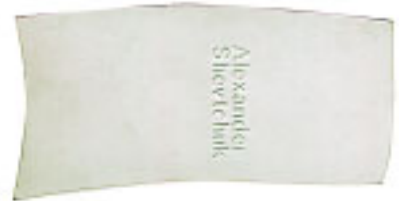
Нетрадиционная форма выделяет визитку из ряда стандартных форм