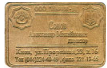
Эта визитка производителя кожаных изделий сделана из куска кожи

чатать офсетом, выжигать лазером, ламинировать, использовать выборочную лакировку, и намеренно, вскоре стали бы клеивать в бумагу микро-чип, содержащий рекламную страницу, если бы не наступил августовский кризис.